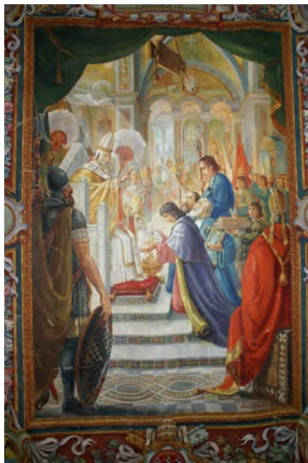
Zatwierdzenie Zakonu Ducha Świętego

w szczególny sposób przedstawić go Kościołowi Bożemu, do którego nadał przemawia poprzez swoją wiarę i dzieła miłosierdzia" – napisał papież.